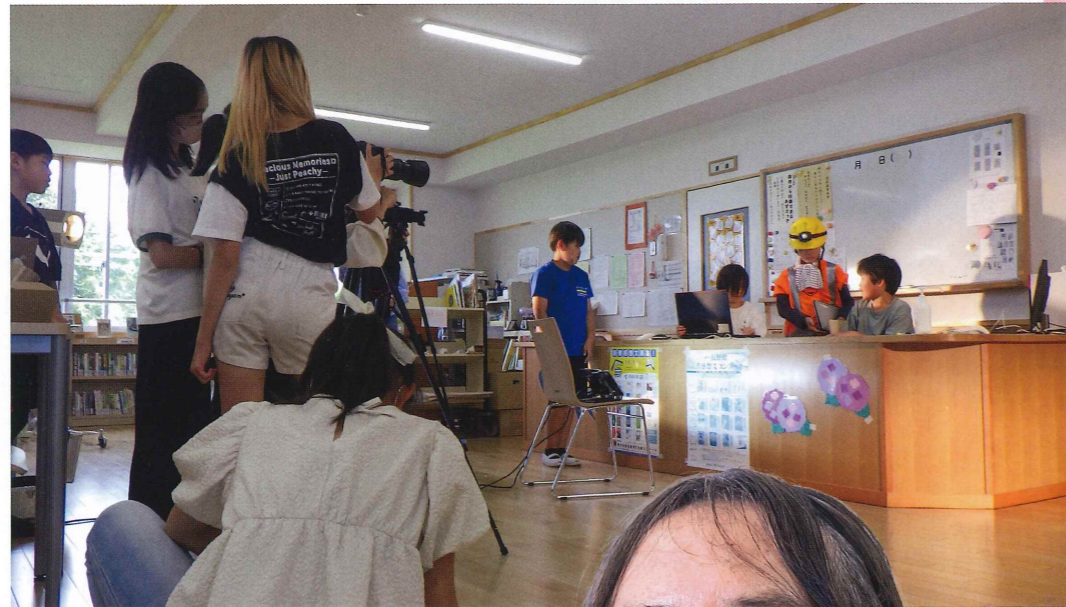
撮影時の一コマ。役者もカメラ、照明等のスタッフも真剣そのもの。